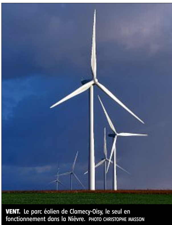
VENT. Le parc éolien de Clamecy-Oisy, le seul en fonctionnement dans la Nièvre.

Une situation qui fait tempêter les opposants.