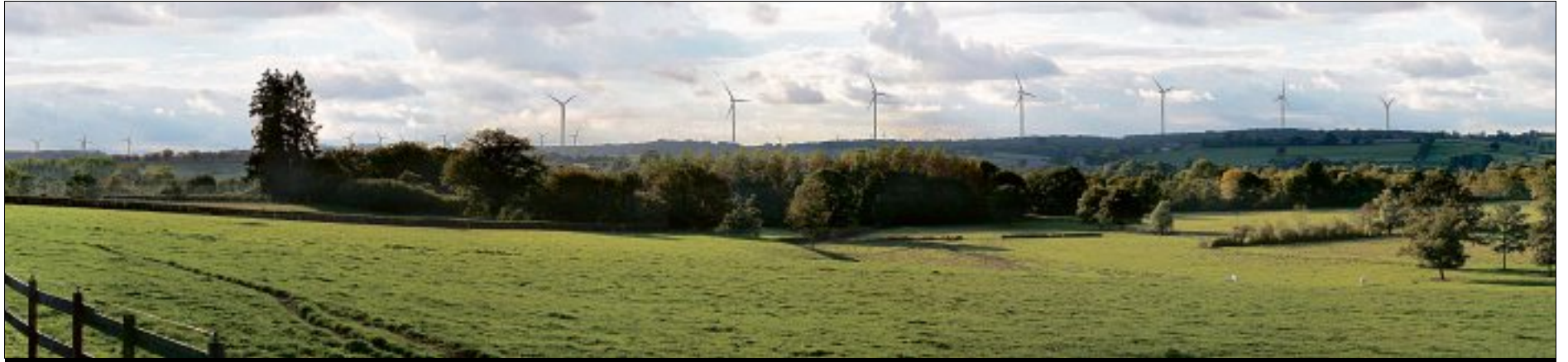
PAYSAGE. Vue de Vandenesse, proche du canal du Nivernais. Au premier plan, Isenay ; au fond Cergy-la-Tour et Saint-Gratien-Savigny.

Deux réunions publiques pour exposer les projets éoliens du Morvan auront lieu, mardi 17 mai à Fours, et mercredi 18 à Luzy. Les questions de la population y sont attendues.